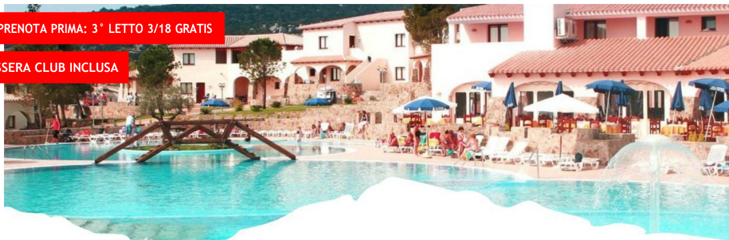
Club Esse Cala Gonone Beach Village