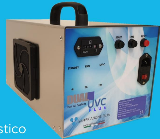
DUAL UV-C PLUS

Uso professionale e domestico in presenza di persone